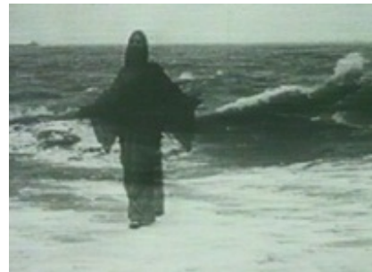
Abb. 2 Still aus: Le Christ marchant sur les flots (Christ walking on Water; Frankreich 1899 / 1900.

1897 wird der Film Industriezweig: Die Brüder Charles und Emile Pathé gründen die Firma Pathé Cinema zur Massenproduktion eigener Filme im großen Stil. Die ersten Jesus-Filme werden teilweise von der Katholischen Kirche produziert bzw.