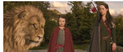
Abb. 18 Still aus: Die Chroniken von Narnia: Der König von Narnia (THE CHRONICLES OF NARNIA: THE LION, THE WITCH AND THE WARDROBE; USA 2005.