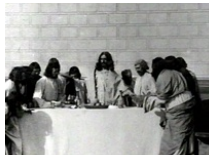
Abb. 1 Still aus: Das Leben und die Passion Jesu Christi (Frankreich 1897).