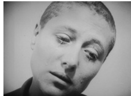
Abb. 17 Still aus: Die Passion der Jungfrau von Orléans.