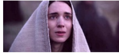
Abb. 16 Still aus: Maria Magdalena (Mary Magdalene; USA, Vereinigtes Königreich, Australien 2018).