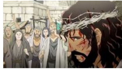
Abb. 36 Still aus: Die letzten drei Tage (Japan 2013).