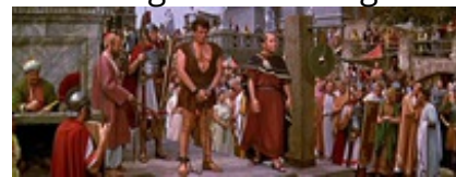
Abb. 7 Still aus: Das Gewand.