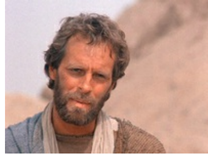
Abb. 13 Still aus: Und sie erkannten ihn nicht (Fernsehtitel; Alternativer (DVD)Titel: Die Untersuchung. Italien 1986.