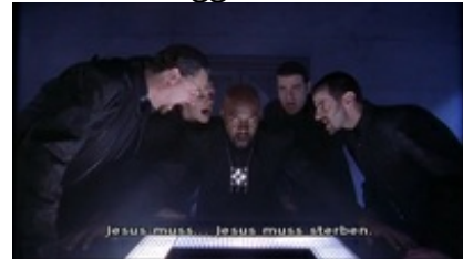
Abb. 29 Still aus: Jesus Christ Superstar (England 2000).