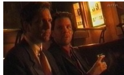
Abb. 20 Still aus: Das Buch des Lebens (USA 1998).

Im Gegensatz zum Teufel und zu manchen Sektenanhängern zweifelt Jesus an seiner Mission, verweigert das Ewige Gericht und opfert sich erneut für die Menschen. Der Film greift Fragestellungen nach dem endzeitlichen Weltgericht, nach christlicher Rechtfertigungslehre und Verantwortung und Schuld auf.