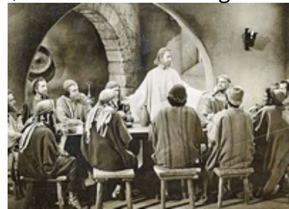
Abb. 8 Still aus: Day of Triumph (USA 1954).

die Passion Jesu. Gewaltbereite Zeloten wagen immer wieder den Aufstand gegen die römische Besatzungsmacht. Unter diesen sind der Gewürzhändler Zadok und sein Freund Judas. Judas erzählt ihm von dem Volksprediger Jesus, der Wunder vollbringt. Dieser habe großen Einfluss auf die jüdischen Volksmassen und Jesus könne die Befreiungsbewegung anführen und einen Angriff mobilisieren. Barabbas, der ebenfalls zu dieser Gruppe gehört, wird von den Römern in Jerusalem gefangen genommen. Zadok schickt Judas zu Jesus. Er soll Jesus bitten, eine Befreiungsaktion zu führen.