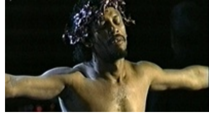
Abb. 33 Still aus: Markus-Passion (La Pasi3n seg3n San Marcos).