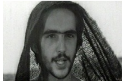
Abb. 10 Still aus: Das 1. Evangelium Matthäus (IL VANGELO SECONDO MATTEO; Italien / Frankreich 1964).