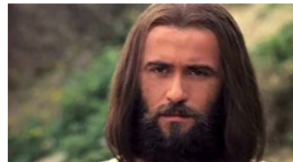
Abb. 12 Still aus: Jesus (JESUS; USA 1979).