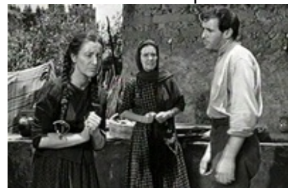
Abb. 22 Still aus: Nazarin.