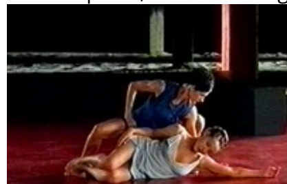
Abb. 34 Still aus: Annonciation (Frankreich 2002; Regie: Angelin Preljocaj).