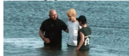
Abb. 24 Still aus: Tore tanzt.