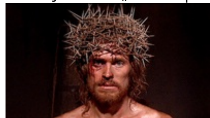
Abb. 26 Still aus: Die letzte Versuchung Christi (THE LAST