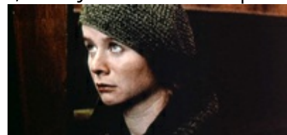
Abb. 19 Still aus: Breaking the Waves (Dänemark/F 1996).