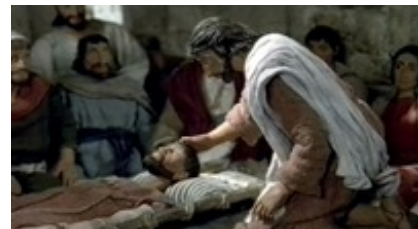
Abb. 35 Still aus: Der Mann der tausend Wunder (MIRACLE MAKER; Großbritannien 2000 / 2003).