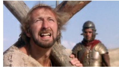
Abb. 25 Still aus: Monty Python's Das Leben des Brian (Großbritannien; 1979).