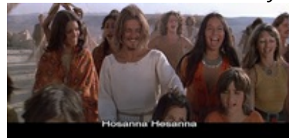
Abb. 28 Still aus: Jesus Christ Superstar (USA 1972).