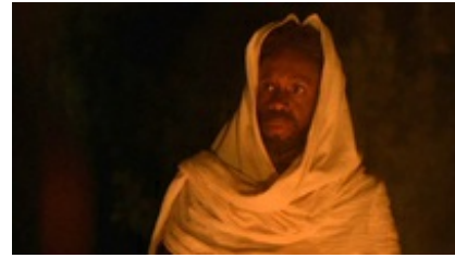
Abb. 15 Still aus: Color of Cross (COLOR OF THE CROSS; USA 2006).

Ein sozialkritischer Film kommt 2006 heraus: