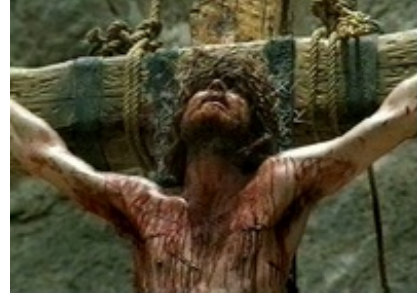
Abb. 14 Still aus: Die Bibel: Jesus (Deutschland / Italien / USA 1999).

Im gleichen Jahr erscheint in Frankreich der gleichnamige Filmtitel, jetzt als TV-Spielfilm Version: