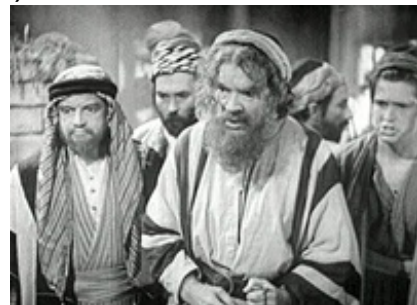
Abb. 6 Still aus: The Great Commandment (Die Zehn Gebote;