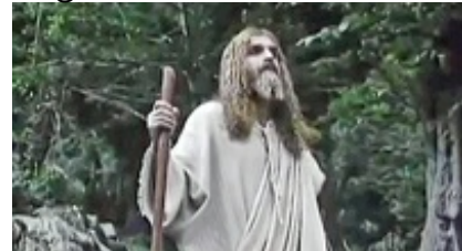
Abb. 37 Still aus: AL-MASIH (JESUS THE SPIRIT OF GOD; THE MESSIAH; 2007.

Talebzadeh will mit seinem Film den Dialog von Christen und Muslimen verstärken: „In meinem Film wird Jesus sehr hoch verehrt und wirkt sogar mehr Wunder als in der Bibel. Wir erwarten seine Rückkehr auf die Erde am Ende der Zeit, wenn gläubige Christen und Muslime Seite an Seite in einer gewaltigen Schlacht kämpfen werden.“ (Reinhold Zwick: Herder Korrespondenz (2007). Der Film wurde 2007 mit dem Preis für den interreligiösen Dialog auf dem „Religion Today Film Festival“ in Trient ausgezeichnet.