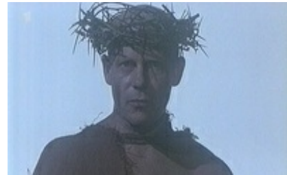
Abb. 31 Still aus: Es wäre gut, daß ein Mensch würde umbracht für das Volk.