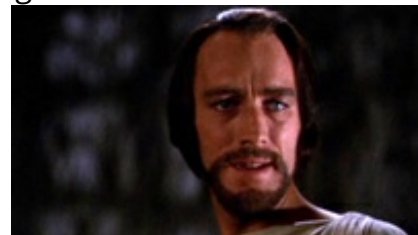
Abb. 9 Still aus: Die größte Geschichte aller Zeiten (THE GREATEST STORY EVER TOLD; USA 1963).