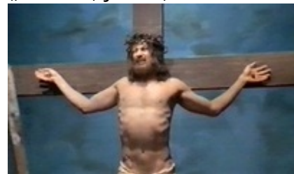
Abb. 27 Still aus: Der Gefallen, die Uhr und der sehr große Fisch.