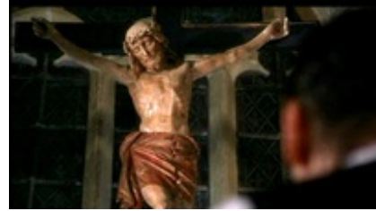
Abb. 23 Still aus: Chocolat (USA 2000).