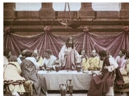
Abb. 3 Still aus: Das Leben und die Passion Jesu Christi (USA 1905).