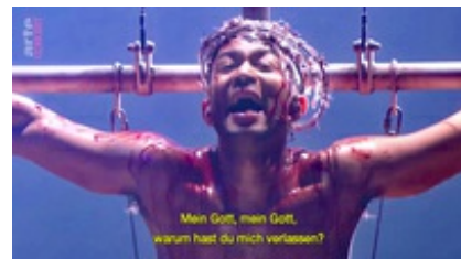
Abb. 30 Still aus: Jesus Christ Superstar - Live in Concert (USA 2019).