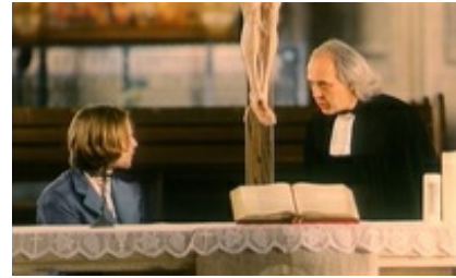
Abb. 21 Still aus: Mensch Jesus.