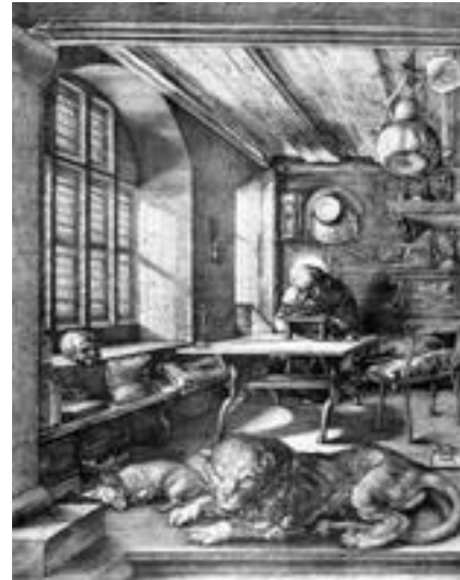
Abb. 2 Hieronymus (Albrecht Dürer; 1514).

Sein Interesse an der hebräischen Sprache dokumentiert auch das Werk Liber interpretationis hebraicorum nominum , wofür Hieronymus z.T. auf griechische Vorarbeiten zurückgreifen kann (vgl. sein Vorwort). Es basiert auf der